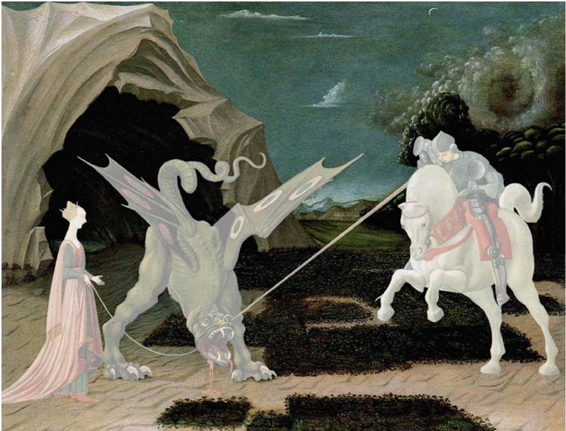
PAOLO UCCELLO, San Giorgio e il drago , 1456 (National Gallery, Londra) – rielaborazione