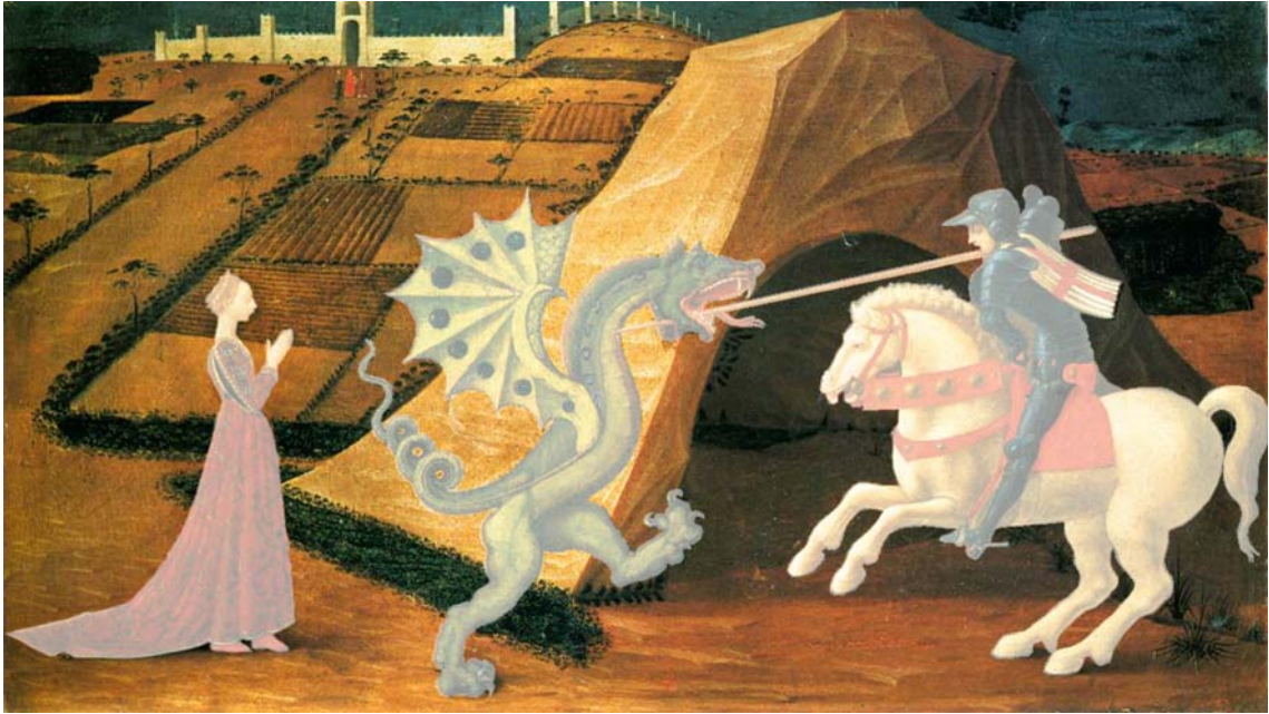
PAOLO UCCELLO, San Giorgio e il drago , 1460 (Museo Jacquemart André di Parigi) – rielaborazione