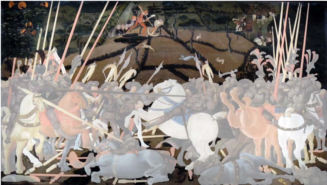
PAOLO UCCELLO, Battaglia di San Romano , trittico, Disarcionamento di Bernardino della Ciarda , 1438 (Gallerie degli Uffizi, Firenze) – Tutte le rielaborazioni grafiche sono a cura di chi scrive

Io prendo un quadro, voi prendete un quadro. Deve essere un quadro, naturalmente, che vi piace; ma deve essere un quadro come dico io: di quelli dove succede qualcosa, di solito anche cose terribili, come battaglie e decapitazioni, scannamenti e scorticamenti di martiri. [...] nella Battaglia di San Romano , un anello grande di lance cavalli cimieri e moltitudine che combatte, ma al centro dell'anello, come nell'occhio immobile del ciclone, dove tutto è silenzio e pace, ci sono i campi arati, la siepe attorno, e una caccia di lepri e di levrieri. E il piacer profondo che uno ricava dalla vista di questi quadri (Flaiano la chiama a un certo punto allegria) è proprio questo: la presenza – ma perdio la presenza continua – di questo orizzonte al di là degli episodi.