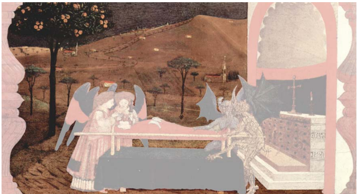
PAOLO UCCELLO, Miracolo dell'ostia profanata, predella , 1467-1468 (Galleria nazionale delle Marche, Urbino) – rielaborazione