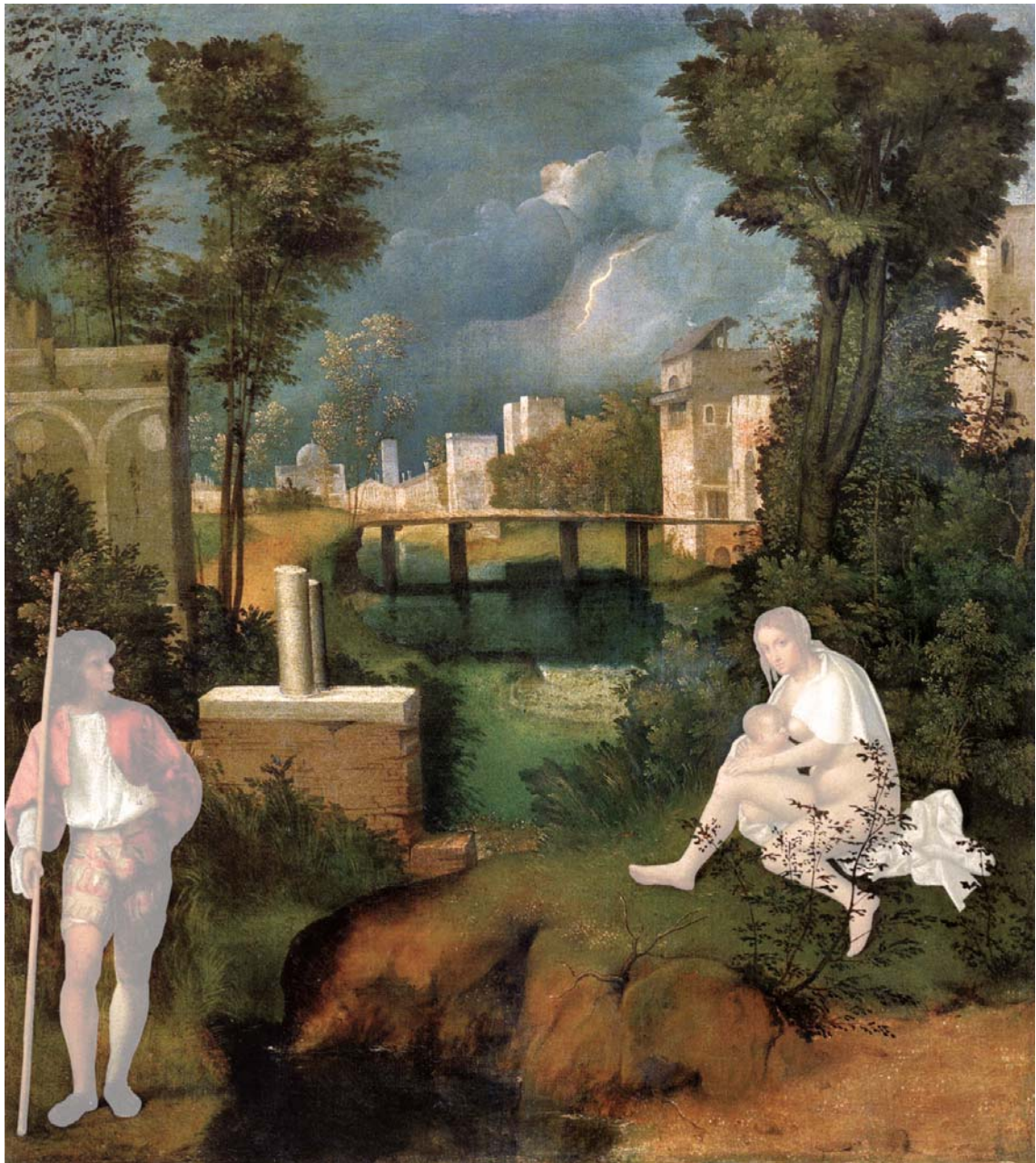
GIORGIONE, La tempesta , 1502-1503 (Gallerie dell'Accademia, Venezia) – rielaborazione